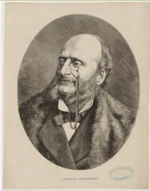
Jacques Offenbach / H. Thiriat Thiriat, Henri (18..-19..). Graveur 1875

http://gallica.bnf.fr/ark:/12148/btv1b8423242k