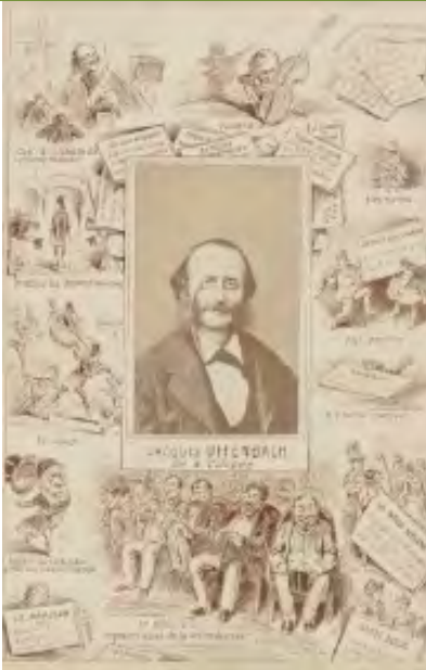
Photo-biographie des contemporains : Jacques Offenbach / Carlo Gripp et Pierre Durat Gripp, Carlo (18..-18.. ; graveur). Graveur Durat, Pierre (18..-18.. ; photographe). Photographe 1866

http://gallica.bnf.fr/ark:/12148/btv1b84232326