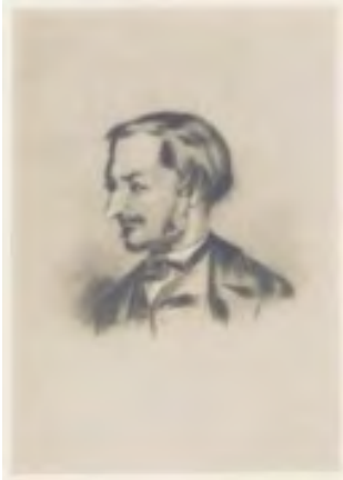
Jacques Offenbachn 1850

http://gallica.bnf.fr/ark:/12148/btv1b8423245t