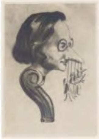
Jacques Offenbach 1850

http://gallica.bnf.fr/ark:/12148/btv1b8423245t