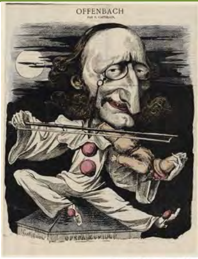
Offenbach / Date d'édition : 1870

http://gallica.bnf.fr/ark:/12148/btv1b90482722