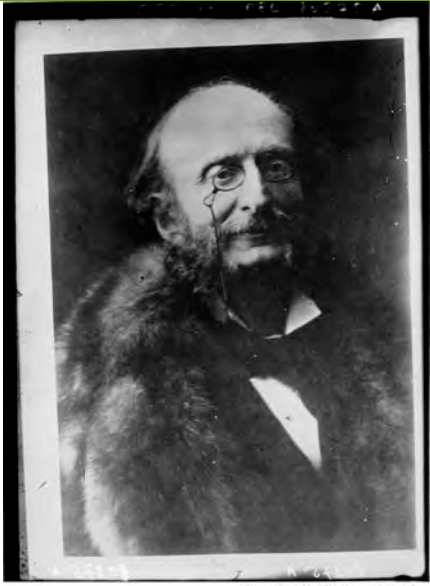
Jacques Offenbach (portrait reproduction) : [photographie de presse] / Agence Meurisse 1930

http://gallica.bnf.fr/ark:/12148/btv1b90482722