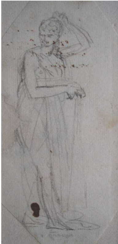
Gérard, « Etude pour Mme Récamier », Paris, Musée Carnavalet.

www.napoleon.org/histoire-des-2-empires/articles/autour-de-quelques-chefs-doeuvre-de-la-peinture-napoleonienne © Fondation Napoléon