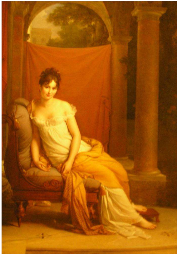
Gérard, « Madame Récamier », Paris, Musée Carnavalet. Photo de l'auteur.

www.napoleon.org/histoire-des-2-empires/articles/autour-de-quelques-chefs-doeuvre-de-la-peinture-napoleonienne © Fondation Napoléon