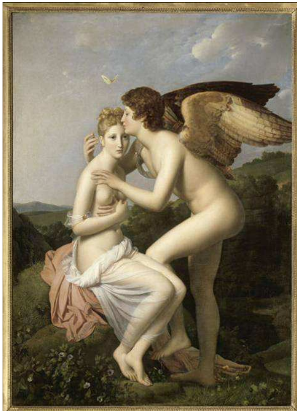
Gérard, « Psyché et l'Amour », Musée du Louvre.