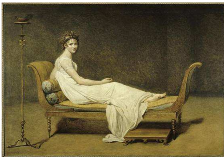
David, « Madame Récamier », Musée du Louvre.