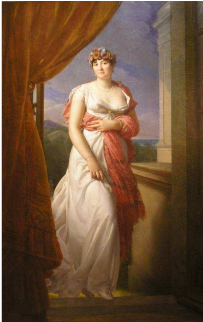
Gérard, « Mme Tallien », Paris, Musée Carnavalet.

www.napoleon.org/histoire-des-2-empires/articles/autour-de-quelques-chefs-doeuvre-de-la-peinture-napoleonienne © Fondation Napoléon