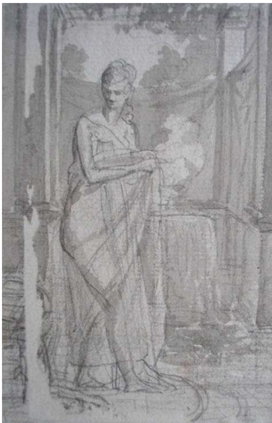
Gérard, « Etude pour Mme Récamier », Paris, Musée Carnavalet.