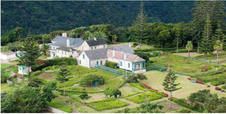
Vue aérienne de Longwood

Sur l'île de Sainte-Hélène, il existe aujourd'hui une enclave française, les domaines français de Sainte-Hélène , qui dépendent du ministère des Affaires étrangères français.