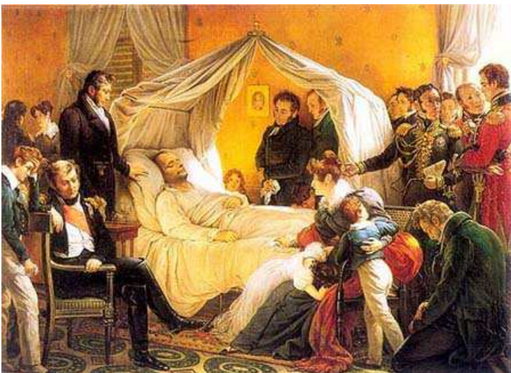
Mort de Napoléon , par Charles Steuben, 1821, conservé au Napoleonmuseum d'Arenenberg (Suisse)

À Sainte-Hélène, il passe de longues heures à dicter le récit de ses campagnes à Las Cases et aux généraux Bertrand, de Montholon et Gourgaud.