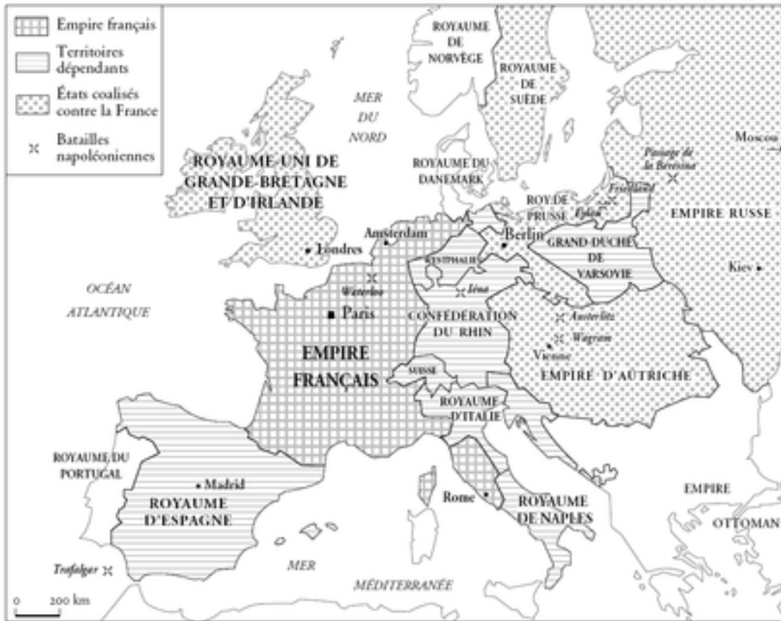
L'Europe sous Napoléon