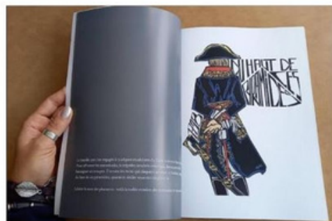
Exposition Napoléon par Redpalm.

Mais, au-delà des dessins, seront également exposés tous les croquis préparatoires, les études utiles à leur réalisation. Bien sûr, il sera également possible de se procurer le livre « Collection Il-